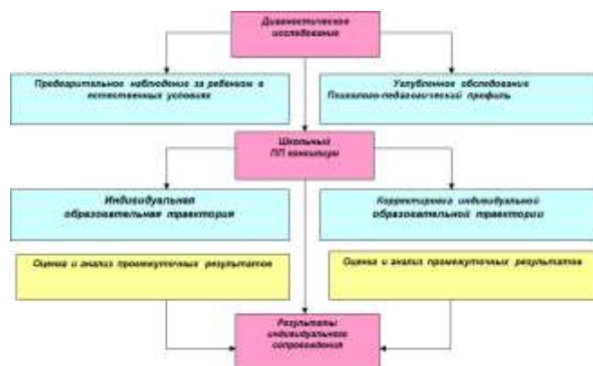
Рисунок 2. Схема взаимодействия педагогов и специалистов

2. Социальное партнёрство - взаимодействие педагогов и специалистов на уровне общеобразовательного учреждения с другими организациями на основе договоров и соглашений о сотрудничестве по решению вопросов образования, охраны здоровья, социальной защиты и поддержки учащихся. Взаимодействие осуществляется со следующими организациями: